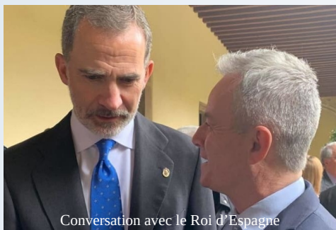
Conversation avec le Roi d'Espagne

Nouvelle rubrique apportée à ce second numéro, le portrait. Nous souhaitons évoquer, au travers de ces quelques lignes, des personnages qui auront marqué les quinze années d'investissement autour de la redécouverte de saint Martin de Tours. Et tout naturellement nous est venue l'idée d'entamer cette série avec celui par qui tout a commencé.