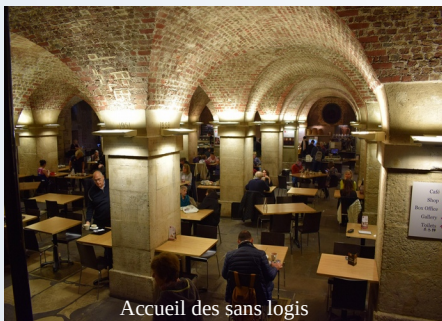
Accueil des sans logis

L'église St Martin-in-the-Fields (littéralement, Saint-Martin-des-Champs ) est une église anglicane située au coin nord-est de Trafalgar Square dans la Cité de Westminster à Londres.