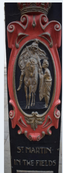
Mobilier urbain autour de l'église