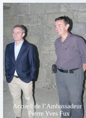
Accueil de l'Ambassadeur Pierre Yves Fux

basilique tourangelle est inauguré. L'attaché de presse devient alors directeur du Centre Culturel Européen Saint Martin de Tours avec pour mission le développement de « l'Itinéraire Culturel Européen Saint Martin de Tours », labellisé depuis septembre 2005 « Itinéraire Culturel du Conseil de l'Europe »