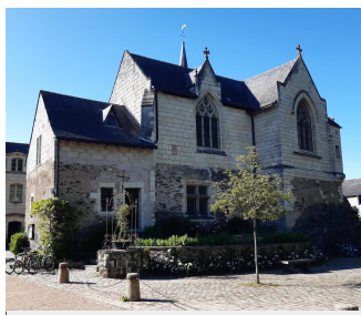
Notre-Dame de Béhuard

Depuis plusieurs mois, les bénévoles de l'association Loire Chemins de Saint Martin travaillent d'arrache-pied à la finalisation du tracé de la Via sancti Martini entre Nantes et Tours. Ce chemin, compte tenu d'un relief assez peu accidenté, ne présente pas de difficulté notable. Seuls la traversée des promontoires dominant la Loire entre Le Cellier et Saint Florent le