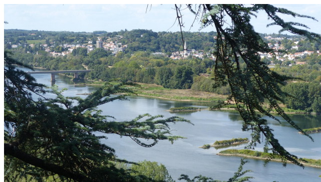
La Loire entre Oudon et Champtoceaux

Le départ à Nantes se fait au Passage Sainte Croix, centre culturel du Diocèse de Nantes. Un carnet de pèlerin martinien est délivré par Loire Chemins de Saint Martin, moyennant adhésion. Ce dernier peut être présenté dans les hébergements proposés. L'association vous assiste dans la préparation de votre chemin. Ses différents relais tout au long du parcours peuvent vous aider en cas de difficulté. Une équipe est plus particulièrement en charge de l'accueil à Tours. Pour vous lancer dans cette aventure, adresser un message à : loirecheminstmartin@gmail.com