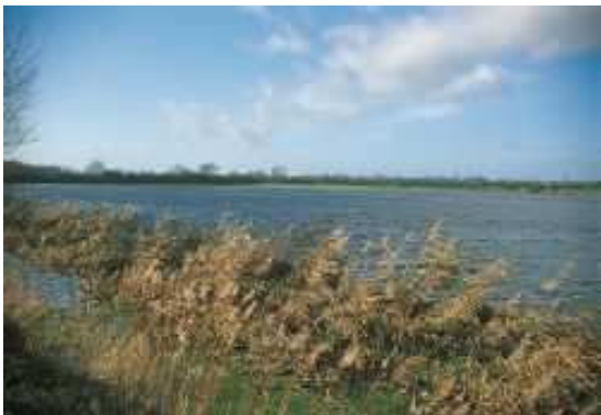
Marais de Carentan (parc des marais du Cotentin et du Bessin)

L'encadrement de chaque journée, les visites et le retour en bus au point de départ de la journée sont compris dans les tarifs indiqués. Chaque marcheur apportera son pique-nique. Les membres de l'Association bénéficient d'un tarif préférentiel. Une liste d'adresses d'hébergements variés situés à proximité de chaque étape est à la disposition de chacun afin qu'il puisse réserver directement l'hébergement de son choix et rejoindre ainsi le groupe pour tout ou partie du parcours de Carentan au Mont.