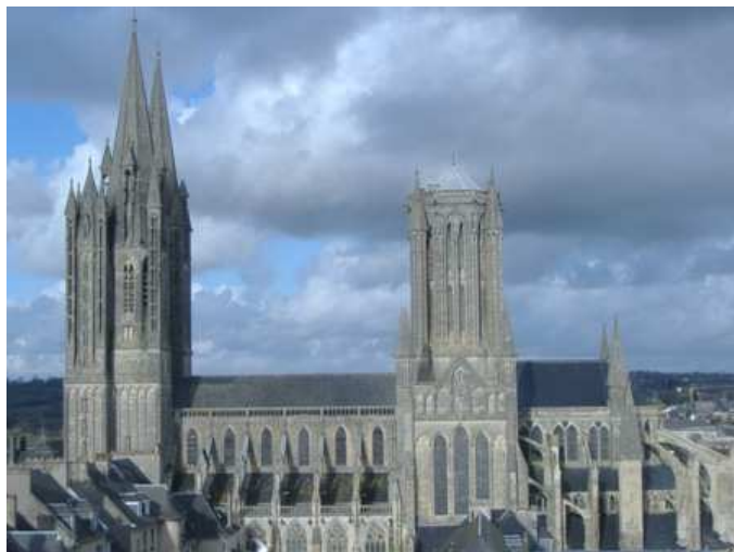
Cathédrale de Coutances vue de l'église Saint-Pierre.

Le Chemin de Carentan au Mont correspond à la partie centrale et méridionale du Chemin de Barfleur au Mont-Saint-Michel. C'est l'un des « Chemins au Anglais » qui rappellent le passage des pèlerins et des voyageurs Anglais qui débarquaient dans le Cotentin pour rejoindre le Mont et parfois Compostelle. Le chemin proposé traverse la zone des marais de Carentan puis rejoint Coutances à travers un paysage vallonné riche d'éléments patrimoniaux. Après Coutances, des étapes méconnues entre Coutançais et pays de Granville vous feront découvrir Cérences et La Haye-Pesnel, au cœur des Chemins montais historiques, avec une visite à l'abbaye de La Lucerne. Une fois la côte rejointe à Carolles, les miquelots gagneront Dragey-Plage pour une traversée inédite vers le Mont et un retour en bus à Carolles.