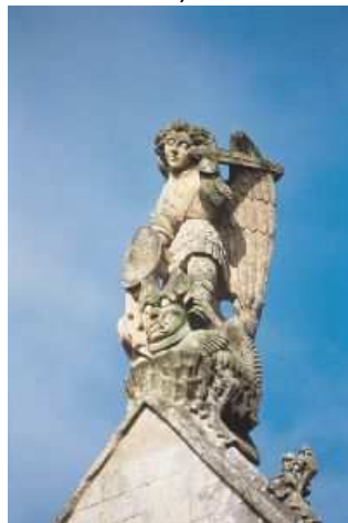
Carentan, église Notre-Dame, Saint- Michel (XV e s.) au sommet du pignon du bras sud du transept

☞ RDV 8 h 45 église de Carolles Pause historique à Saint-Jean-le-Thomas Traversée depuis Dragey-Plage à 13 h 45. Arrivée à 17 h Temps libre sur le Mont (retrait Diplômes du Miquelot , visite libre...) 19 h Départ du bus du Mont, arrivée à Carolles à 20 h