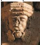
Saint-Sauveur-Lendelin, église, porche XIII e siècle (détail).

Cette année, pour des raisons pratiques, la formule au forfait se limitera à 22 personnes et sera close sans préavis ; elle est notamment ouverte aux primo-participants isolés.