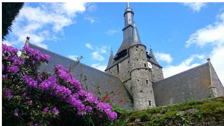
Eglise de Brecé

Tout le monde peut participer à une ou plusieurs journées de marche. L'inscription préalable est toutefois nécessaire. L'encadrement de chaque journée, les visites et le retour en bus au point de départ de la journée sont compris dans les tarifs indiqués. Chaque marcheur apportera son pique-nique. Les membres de l'Association bénéficient d'un tarif préférentiel. Une liste d'adresses d'hébergements variés situés à proximité de chaque étape est à la disposition de chacun afin qu'il puisse réserver directement l'hébergement de son choix et rejoindre ainsi le groupe pour tout ou partie du parcours de Mayenne au Mont.