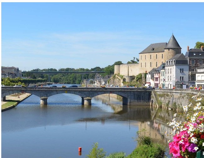
Château de Mayenne et pont sur la Mayenne (cl. Mayenne Communauté).

Tout ce pays mayennais du Haut-Maine était parcouru par les pèlerins qui convergeaient vers le Mont et ont marqué la mémoire collective de ce territoire méconnu, riche d'histoire. Marchez dans leurs pas et devenez ainsi miquelot !