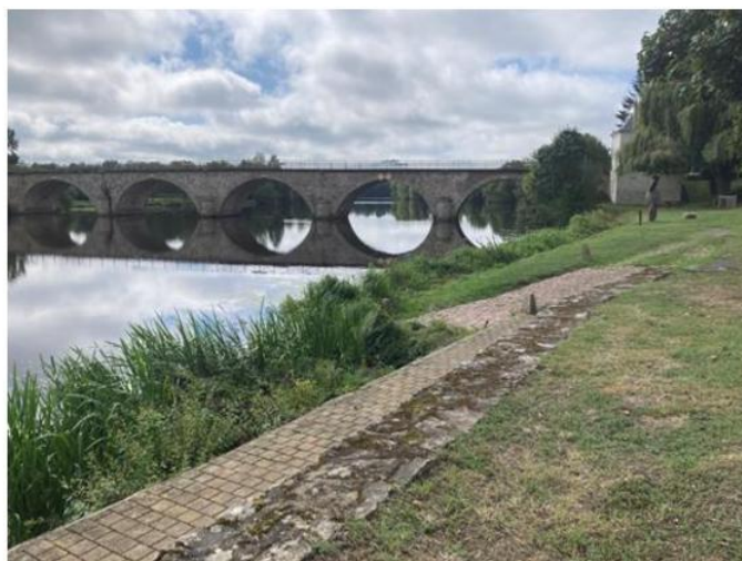
Pont enjambant la Mayenne à Chenillé-Changé (49)

Pour démarrer notre chemin, nous sommes arrivés la veille à Angers et nous avons été hébergés à l'auberge de jeunesse. Senior parmi les jeunes en apprentissage, nous avons eu droit à un repas du soir industriel dont on se demande comment l'on peut servir cela à des jeunes en formation. Le lendemain, munis de notre carnet du pèlerin Miquelot nous démarrons notre périple d'Angers à Pruillé où nous sommes hébergés au camping municipal sous des tentes fixées en hauteur sur un