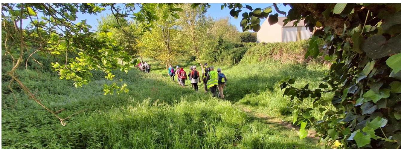
25 avril 2026 : les petits sentiers de Bonchamp respirent le printemps.

Une équipe de bénévoles du Sud-Mayenne a animé un stand au Salon du Bien Vieillir à Château-Gontier le 2 avril . Une belle manifestation animée par les lycéens des BAC professionnels du service à la personne du Lycée Robert Schumann, validant ainsi l'épreuve pratique de leur diplôme. Ce salon met en valeur tout le réseau de services, d'associations, de professionnels qui aident à se sentir bien dans son environnement en vieillissant. Les maîtres-mots sont encore rencontres, échanges, activité, convivialité et vivre ensemble.