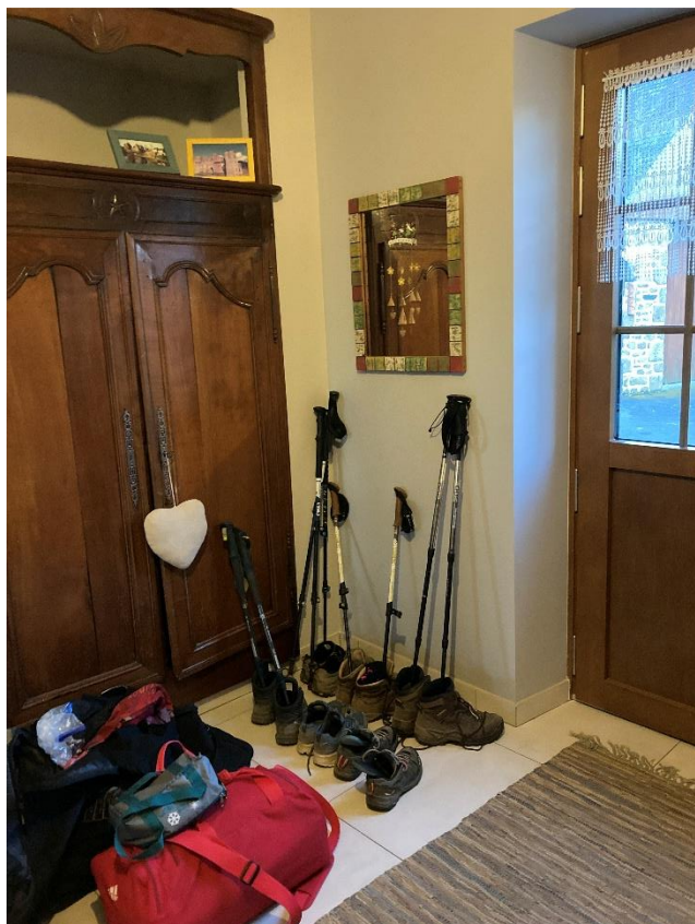
Hébergement à Châtillon-sur-Colmont

Chaque jour, des membres des associations de randonneurs mayennaises sont venus nous rejoindre. Elles ont toujours collaboré aux marches annuelles de Châtillon Patrimoine, et cette amitié de longue date a permis une intégration quasi quotidienne fluide de groupes très différents avec le groupe des 10 marcheurs au long cours, nous invitant à l'ouverture et à l'échange.