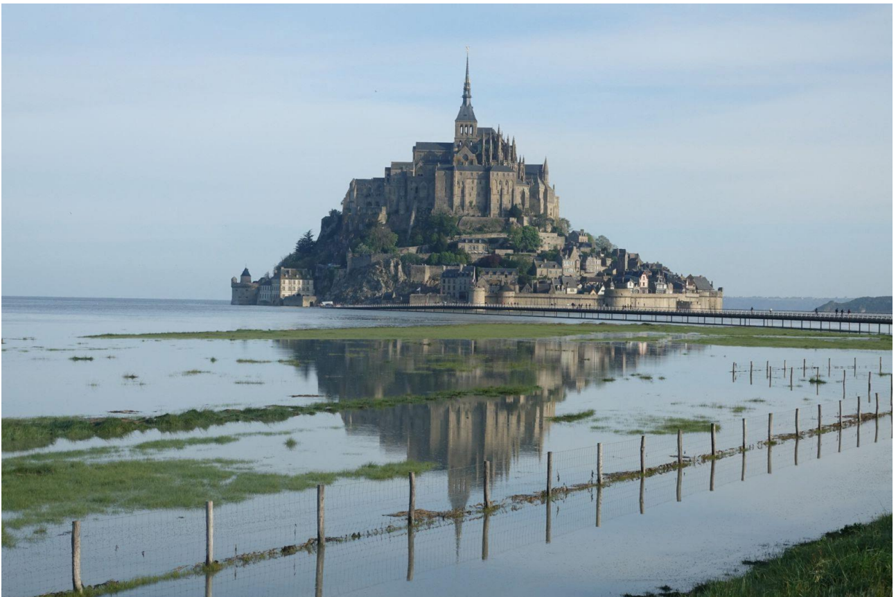
Dimanche 19 avril 2026. La grande marée transforme la Baie du Mont-Saint-Michel